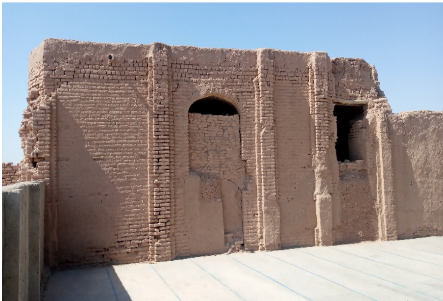
تصویر ۴: نقطه اتصال (سمت چپ) با اتاق تخریب‌شده سمت جنوب خانقاه

اگر بپذیریم که این هشتی به حیاطی راه داشته‌است، نقشه کف اصلی بعد از این نقطه را باید کاملاً حدس زد. فضایی را که احتمالاً حجره‌ها یا تاقدگان، ایوان‌ها یا گنبدخانه‌های اطراف صحن در برگرفته بودند، مسجد تازه بناشده اشغال کرده‌است اما خود وجود صحن بیانگر آن است که ترکیبی از این عناصر در تکمیل این ترکیب بندی مورد استفاده قرار گرفته‌است و بقایای پاتاق در دیوار غربی آشکار می‌سازد که دست کم حجره‌هایی وجود داشته‌است. ۱ فضای بیرونی فقط به گنبدخانه شمالی اشاره خواهد کرد، زیرا گنبدخانه جنوبی تا آن‌جا که از بقایای بنا می‌توان تشخیص داد، متقارن است. نوک دیوار شمالی فرو ریخته‌است اما از دسته‌های نعلی در و پنجره دو تایی می‌توان دریافت که این نقطه مرکب از یک ردیف تاقچه‌نماهایی بوده‌است. در این دیوار دو در وجود دارد، یک در منتهی به گنبدخانه اصلی است و دیگری در روزنه پایانی سمت غرب قرار دارد که به راه‌رو کوچک باز شده‌است. این راه‌رو نیز به نوبه خود به گنبدخانه اصلی و به در دیگری با زاویه ۴۵ درجه راه دارد. دیوار شرقی وضع خوبی ندارد اما قابل تشخیص است که دارای درگاهی بوده که به هشتی مستطیلی باریک و کوچکی در جلو گنبدخانه اصلی منتهی می‌شده‌است. دیوار جنوبی بسیار تخریب شده‌است اما دارای دو بیرون‌نشستگی با زاویه ۴۵ درجه است که به همراه بیرون‌نشستگی‌های گنبدخانه مقابل (که در حال حاضر فروغلطیده)، احتمالاً اضلاع هشت ضلعی