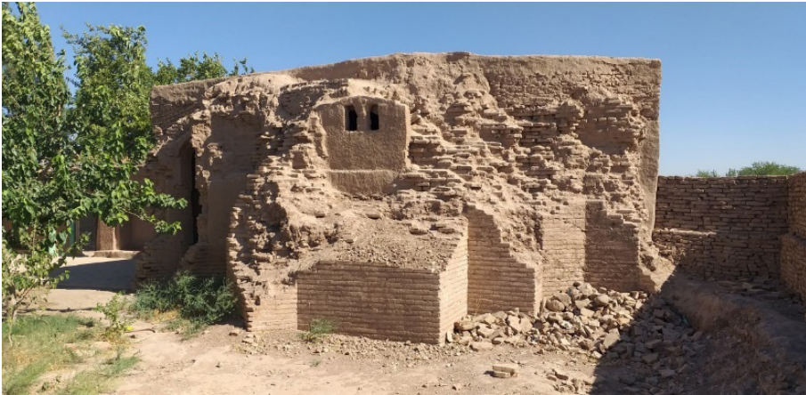
تصویر ۲: بقایای اتاق تخریب شده سمت جنوب خانقاه

احتمالاً در سمت مشرق بنا، یک ایوان ورودی که به هشتی کوچکی منتهی می شده، وجود داشته است. هیچ راه مستقیمی به هشتی و اتاق های گنبددار در هر ضلع به چشم نمی خورد. هشتی شاید به حیاط یا اتاق گنبدداری منتهی می شده است و درین صورت نقشه کف آن مشابه خانقاه ملای کلان در مقیاسی بزرگ تر خواهد بود. با توجه به نحوه گذشتن این هشتی از سلسله زوایای ۴۵ درجه ای پیش از آن که با قسمت موجود در گوشه جنوب غربی گنبدخانه برخورد کنند، تصوّر برپایی گنبدی در این فضا دشوار است.