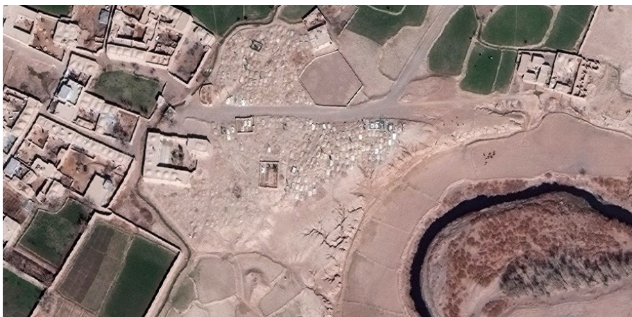
تصویر ۱: تصویر هوایی مزار جلال‌الدین پورانی (در وسط تصویر) و ساختمان خانقاه وی (در راست تصویر)

خواندمیر در خلاصه‌الخبار در توصیف این بنا، عمارت «سر مزار» را به کار برده است. برنارد اوکین نیز با او همنظر است و برای این بنا، «بقعه» را مناسب‌تر می‌داند. بنای فعلی اندکی دور از مزار جلال‌الدین پورانی در طرف غرب آن واقع شده و شاید کاربری‌های دیگری جز بزرگداشت این شیخ نیز داشته است. از آن جایی که جلال‌الدین صوفی مشهوری بوده و افراد زیادی از شهرهای دور و نزدیک به زیارت مزار او می‌آمدند، این بنا احتمالاً برای اقامت کوتاه مدت آنان طراحی شده بود که بعدها به محل تجمع و ارشاد صوفیان تبدیل شد. ۱ این بنا ظاهراً در دوره کشمکش‌های صفویان و شیعیان رو به تخریب گذاشته و طبق گفته فکری سلجوقی دو خانه نفیس از آن باقی بود و به خشت پخته که سقف آن دو خانه به وضعی غریب رسم‌بندی شده، چند سال پیش (دهه سی سده چهاردهم خورشیدی) یکی از این دو خانه، یعنی خانه سمت جنوبی فروغلطید و خانه سمت شمالی خانقاه هنوز پابرجاست، اما مشرف به ویرانی است. ۲ مسجد جدیدی نیز در کنار این بنا ساخته شده است.