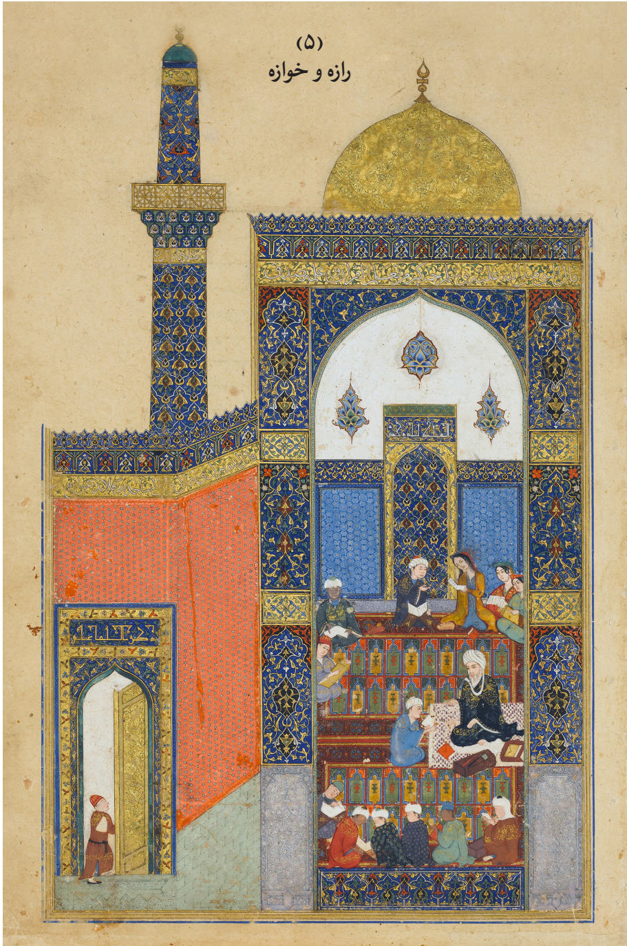
لیلی و مجنون، ۸۳۵ ق.، کتابت جعفر بایسنغری، نسخه شماره ۱۹۹۴.۲۳۲، موزه هنر متروپولیتن، نیویورک.