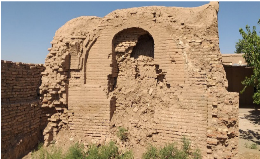
تصویر ۳: دیوار بازمانده از خانه جنوبی تخریب شده در دهه ۱۳۳۰ خورشیدی

احتمالاً در سمت مشرق بنا، یک ایوان ورودی که به هشتی کوچکی منتهی می شده، وجود داشته است. هیچ راه مستقیمی به هشتی و اتاق های گنبددار در هر ضلع به چشم نمی خورد. هشتی شاید به حیاط یا اتاق گنبدداری منتهی می شده است و درین صورت نقشه کف آن مشابه خانقاه ملای کلان در مقیاسی بزرگ تر خواهد بود. با توجه به نحوه گذشتن این هشتی از سلسله زوایای ۴۵ درجه ای پیش از آن که با قسمت موجود در گوشه جنوب غربی گنبدخانه برخورد کنند، تصوّر برپایی گنبدی در این فضا دشوار است.