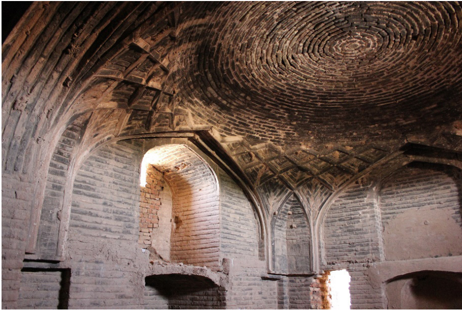
تصویر ۵: تزئینات سقف و یکی از تاق‌های اتاق شمالی موجود از دوره تیموری

با نقشه کف هشت ضلعی نامنظم را تشکیل داده است. در راه رو غرب گنبدخانه در گوشه غربی و با زاویه ۴۵ درجه نسبت به ورودی‌های دیگر باز می‌شود. دیوار غربی ساده است، هر چند در نزدیکی نوک آن بقایای قوسی که دورتر از سمت غرب بر جای مانده، نمایان است. قسمتی از این دیوار، مجاور مسجد جدیدی است که اخیراً به دو گنبدخانه بقیه چسپیده است.