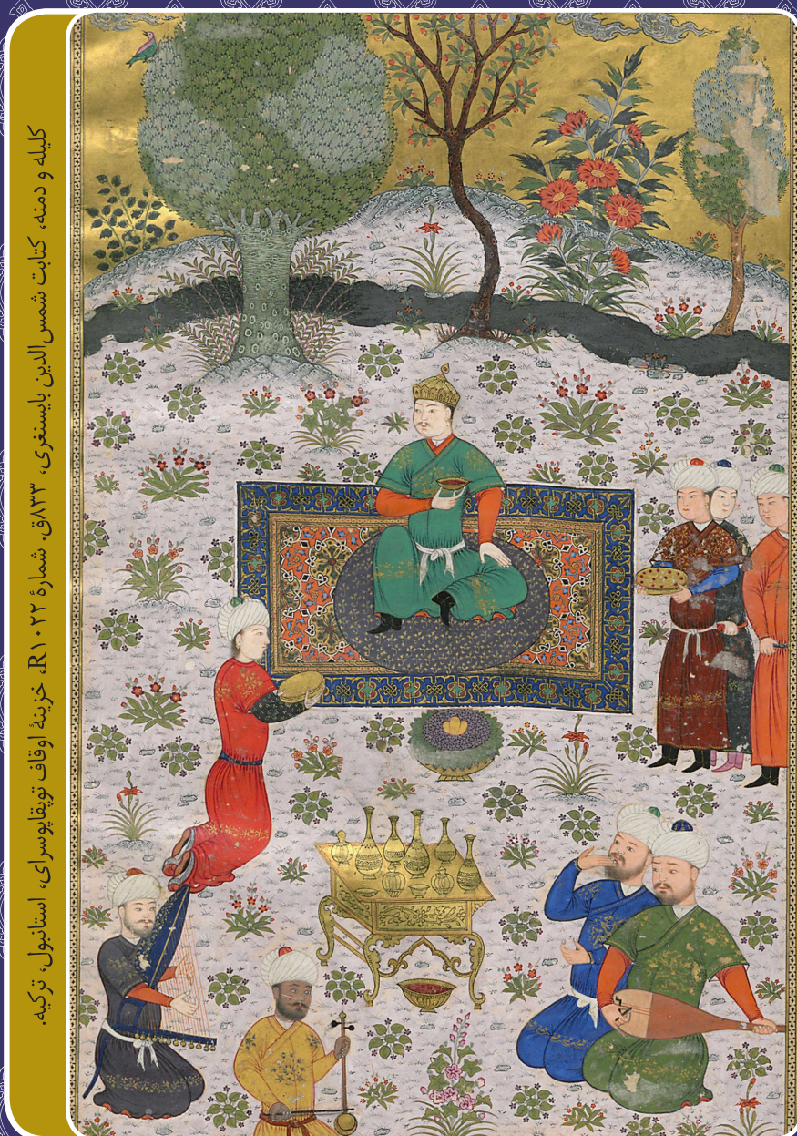
گیله و دمنه، کتابت شمس الدین بایسنغری، ۱۸۳۳ق. شماره ۲۲-۲۱، خزینه اوقاف توقیاطوسرای، استانبول، ترکیه.