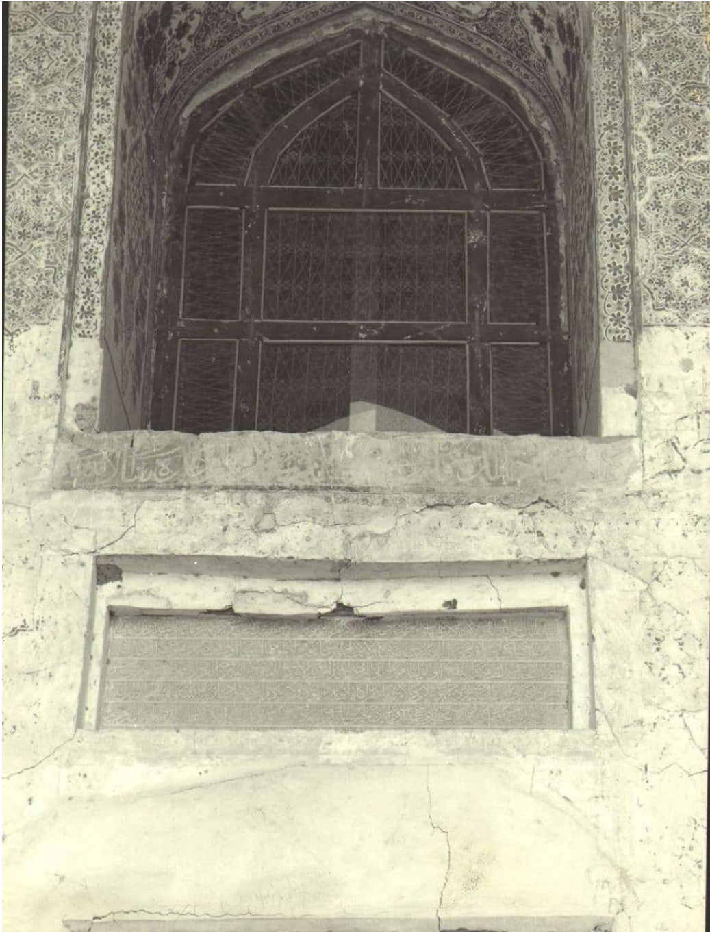
تصویر ۱: کتیبه سردر ورودی مزار ابوالولید آزادانی

سپهر سلطان ظل الله مرکز دائرة امن و امان فرمانفرمای زمین و زمان خسرو گیتی‌ستان صاحبقران تاج‌بخش شاه ابوالغازی معز ملک و دین سلطان حسین خلد الله سبحانه و سلطانه در الدوله الخاقانیه مقرب الحضرت سلطان نظام الدوله و الدین امیرعلیشیر زیدت توفیقه اساس این گنبد شریف و بنای منیف مشهد اشرف را توفیق یافت و بسعی و اهتمام دستور اعظم امین الدوله