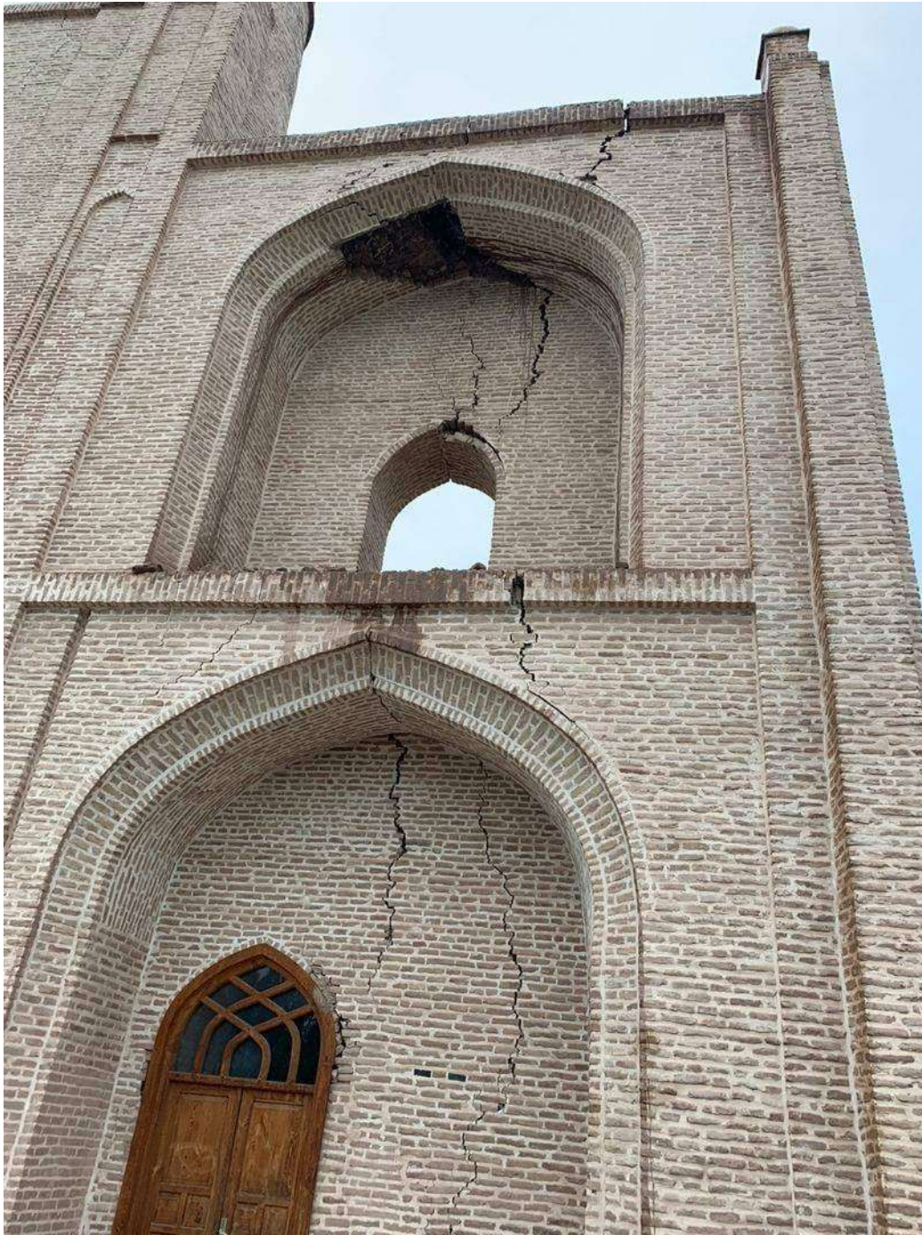
تصویر ۵: شکست طاق سمت شرق مزار؛ عکاس: همایون احمدی، ۱۳۹۹.