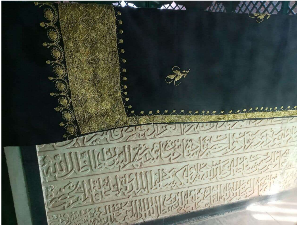
تصویر ۲: کتیبه سردر ورودی مزار محفوظ در داخل ضریح؛ عکاس: حمیدالله کامگار، ۱۳۹۹.

القاهره خواجه قوام الدین نظام الملک بن اسماعیل الخوافی که بانی این مسجد جامع است اتمام یافت.