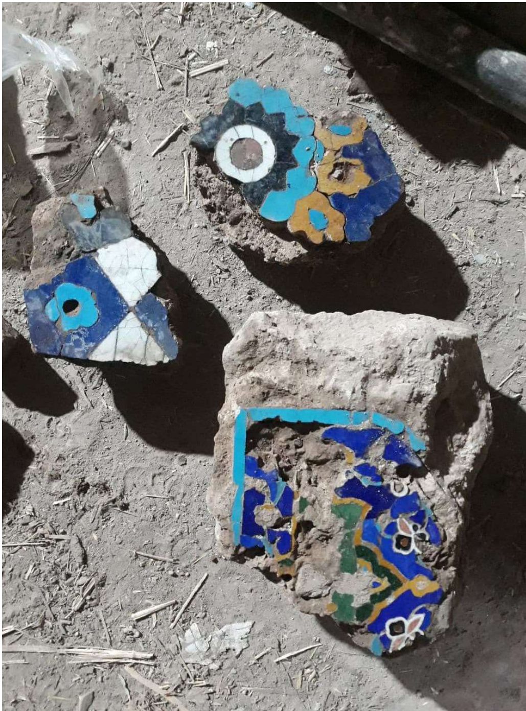
تصویر ۶: قطعه‌های کاشی نویافته از درون طاق سمت شرق بنای مزار ابوالولید آزادانی؛ عکاس: همایون احمدی، ۱۳۹۹.