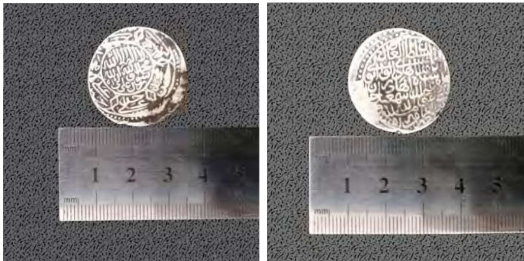
پشت سکه: لا اله الا الله محمد رسول الله على ولي الله و نام دوازده امام در حاشیه محل نگه‌داری: هرات- مؤسسه پژوهشی بایسنغر