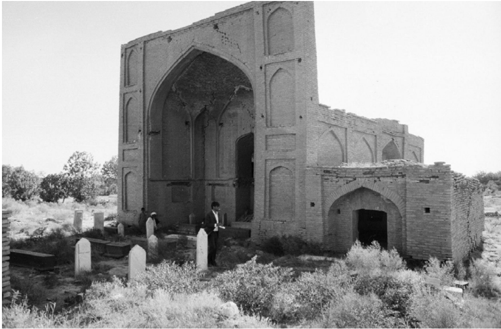
ایوان برناباد از جانب شمال شرقی

بوده طوری که گنبد مرکزی بنا و هم چنین طاق ایوان پیش روی آن کاملاً فروریخته است که این باعث ایجاد رانش و شکست در کمان‌ها و دیوارهای جانبی گردیده است. از طرف دیگر تزئینات گچی داخل بنا اکثراً از بین رفته و تنها در قسمت طاق‌های چهار گوشه، قسمت اندکی از تزئینات باقی مانده که در وضعیت نامناسبی قرار دارد. دیوارهای جانبی دارای آسیب‌های مختلف از جمله شکاف‌ها و ترک‌های بزرگ می‌باشد طوری که دیوار سمت غربی بنا خود را از پیکره اصلی بنا جدا کرده است. خشت‌کاری دیوارها و ایوان بنا بعد از فروریزی گنبد از اثر عوامل محیطی و انسانی آسیب جدی دیده است. خشت‌های به کار رفته در بنا از جنس خشت پخته چهارگوش می‌باشد که تعداد زیادی از خشت‌ها بعد از تخریب بنا پراکنده گردیده و تعدادی نیز در اعمار قبرهای داخل زیارت استفاده شده است. تعدادی از سنگ مزارها و کتیبه‌های تاریخی بنا سرقت شده و برخی دیگر تخریب و یا آسیب دیده است.