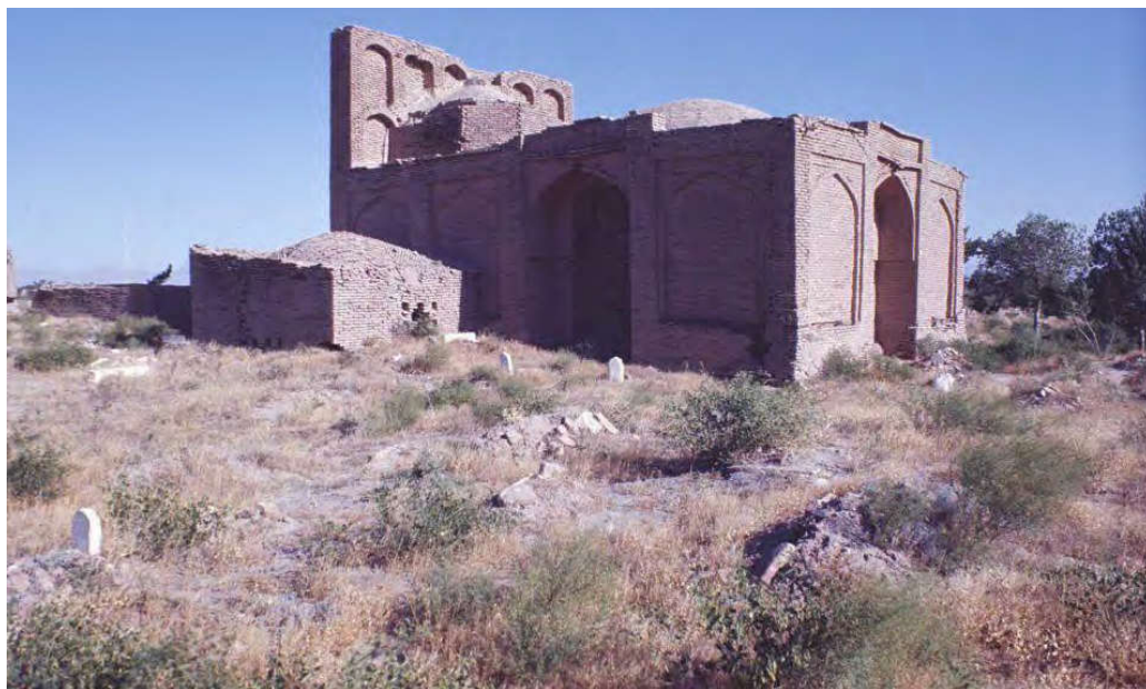
ایوان برناباد از جانب شمال غربی

خدمات معماری و مرمت یاور در خصوص جلوگیری از فروپاشی بنا و مرمت اضطراری آن پیشنهادهای فنی مرمت مطرح شد و مورد استقبال اشتراک‌کنندگان قرار گرفت. از آن جا که بنای مذکور از جمله میراث فرهنگی میهن عزیز ما افغانستان می‌باشد، در جلسه فوق‌الذکر تصمیم گرفته شد تا قبل از اتخاذ تصمیم جهت مرمت بنا، مجوز لازم از وزارت اطلاعات و فرهنگ اخذ گردد. به تعقیب آن در تاریخ ۱۳۹۷/۲/۹ جلسه‌ای در قریه برناباد با اشتراک خانواده میرزایان برناباد، علما، روحانیون، متنفذین و جوانان قریه صورت گرفت. در این جلسه به سلسله مباحث قبلی، اشتراک‌کنندگان جلسه، آمادگی خویش را اعلام کردند. در نتیجه بر اساس فیصله جلسه مذکور و خواست اهالی برناباد درخواستی به تاریخ ۱۳۹۷/۲/۹ عنوانی ریاست اطلاعات و فرهنگ ولایت هرات نوشته شد تا آن ریاست زمینه مرمت بنا را برای مردم محل فراهم کند. در بخشی از متن نامه درخواست چنین آمده است: «ایوان خانقاه خواجه محمدطاهر برنابادی بر اثر گذشت زمان و کم توجهی دچار تخریب‌های فراوان شده و بر اساس مشاهدات روزانه ما ساکنین این قریه، این بنای ارزشمند در صورت عدم رسیدگی عاجل و مرمت اضطراری کاملاً از بین خواهد رفت. بنابراین ما اهالی این قریه به ویژه نوادگان و احفاد میرزایان برناباد از مقام محترم وزارت اطلاعات و فرهنگ صمیمانه خواهشمندیم تا رسیدگی به وضعیت این بنا را در صدر برنامه‌های مرمت خود قرار داده و موجب حفظ و نگهداری این بنای تاریخی و هنر نیاکان ما گردند.» در نتیجه عریضه مذکور، آمریت فرهنگ و هنر ریاست اطلاعات و فرهنگ ولایت